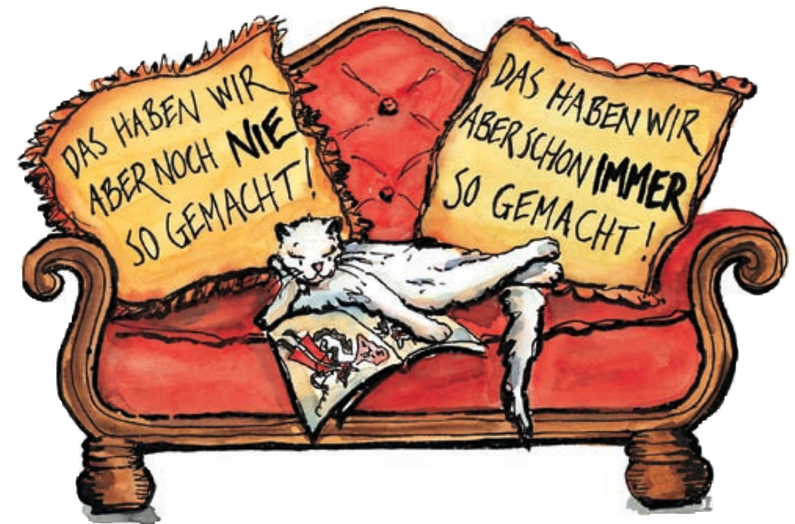
Die beiden Ruhekissen der Bequemlichkeit.